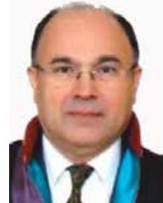
Av. Ahmet ÇOLAK

Elliylayakınzamandanbuyanayaşananlarkarşısında Cemil Meriç:“emperyalizmin taarruzlarına karşı genç zekaları uyarmak için <ideolojiler, idrâkimize giydirilen deli gömleklendir!> demişti... Şimdilerde “deli gömleği” giymemiş, beyni betonlaşmamış ve gönül dünyasına “Berlin duvarı” örülmemiş Öğretmen okulunun hoş görünün kucağında büyüyen vicdanı hür, irfanı hür öğrencilerinin artık çocukları ya da torunları; kendinden olmayan, kendi gibi düşünmeyen, farklı inanç ve fikir, parti mensuplarını “düşman olarak görmeyen” barışın Türkiye’sini mutlaka ama mutlaka inşa edecektir!