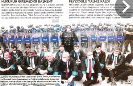
Baro başkanlarının Anıtkabir yürüyüşü engellendi