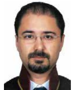
Av. Şafak UĞURLU