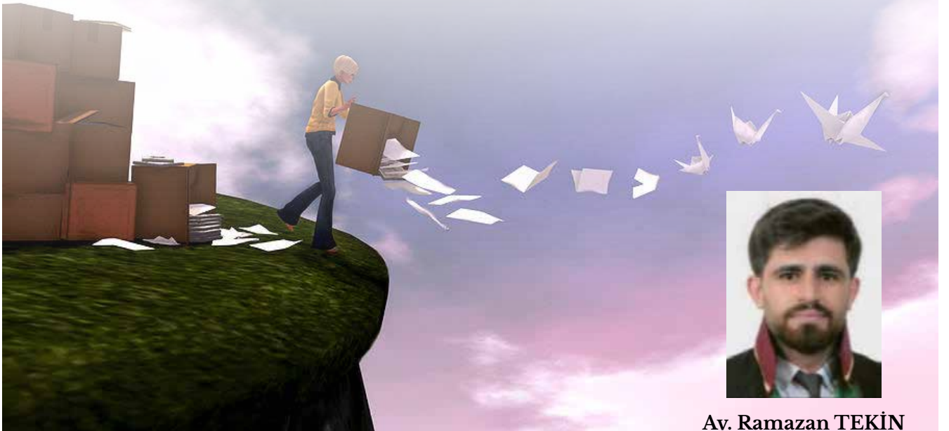
Av. Ramazan TEKİN