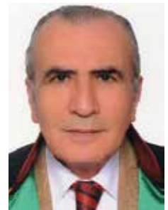
Av. Ali OZANEMRE