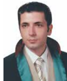
Av. Gürler GAYDAN

Sabah ofise ulaştım. Kırk derece ateşin verdiği şevkle müvekkile, "Mücbir sebeplerden dolayı vekilliginizi yürüttüğüm şu işinizden istifa ediyorum. Gereğini bilgilerinize arz/rica ederim" şeklinde bir telgraf çektim. Hangisini üzerine alındıysa artık! Hızımı alamayıp üniversitedeki icra hukuku profesörüne de bir telgraf yazdım. "Muhtemelen ömrüm boyunca kullanmayacağım iflas, konkordato gibi öğretilerinizi için teşekkürü borç bilirim. Müfredatınıza hemen her gün kullanacağım 'icra müdürü hacze nasıl çıkarılır, soba nasıl tutuşturulur, yazıcı nasıl tamir edilir, rüşvet hangi durumlarda verilmelidir, kim kime arz eder, kim kimden rica etmelidir' gibi güncel konuları da eklemeniz dileğiyle" yazıp yolladım.